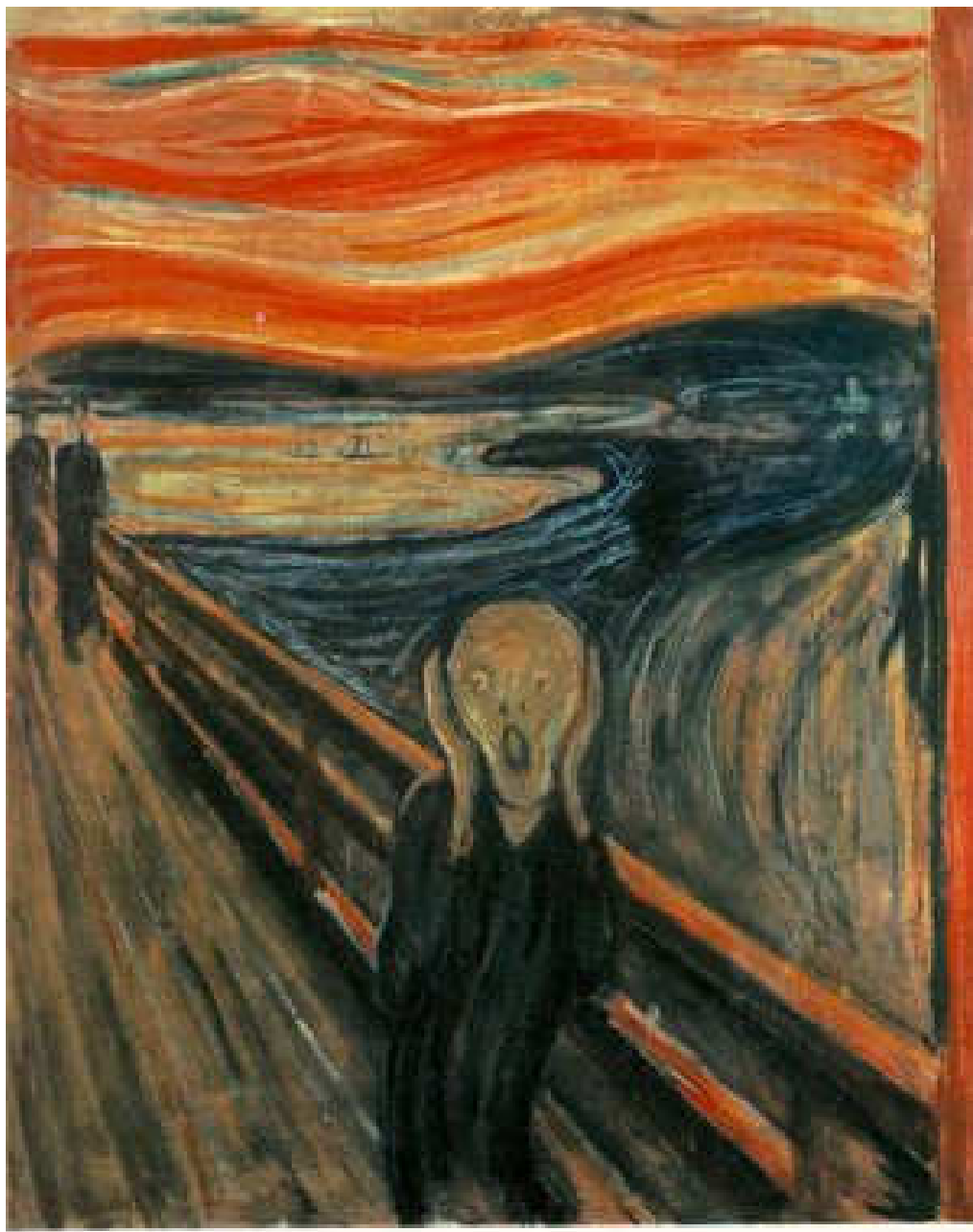
אדוארד מונק "הצעקה" 1893