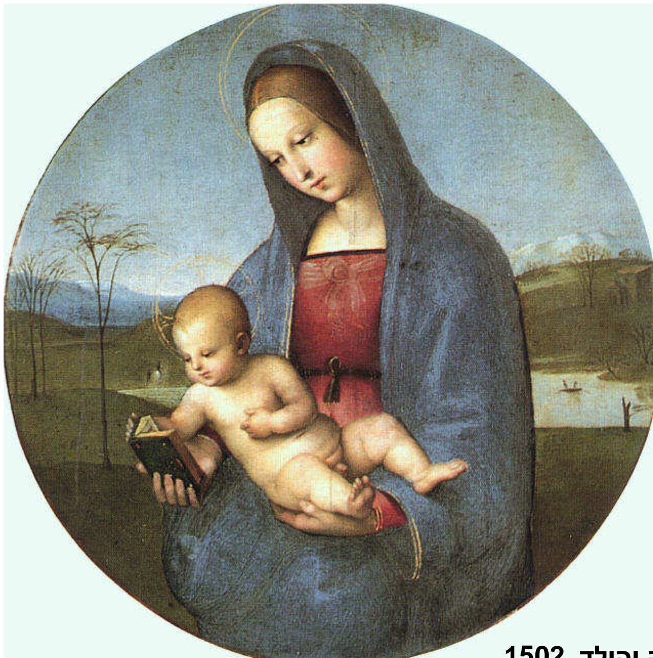
רפאל, מדונה והילד, 1502