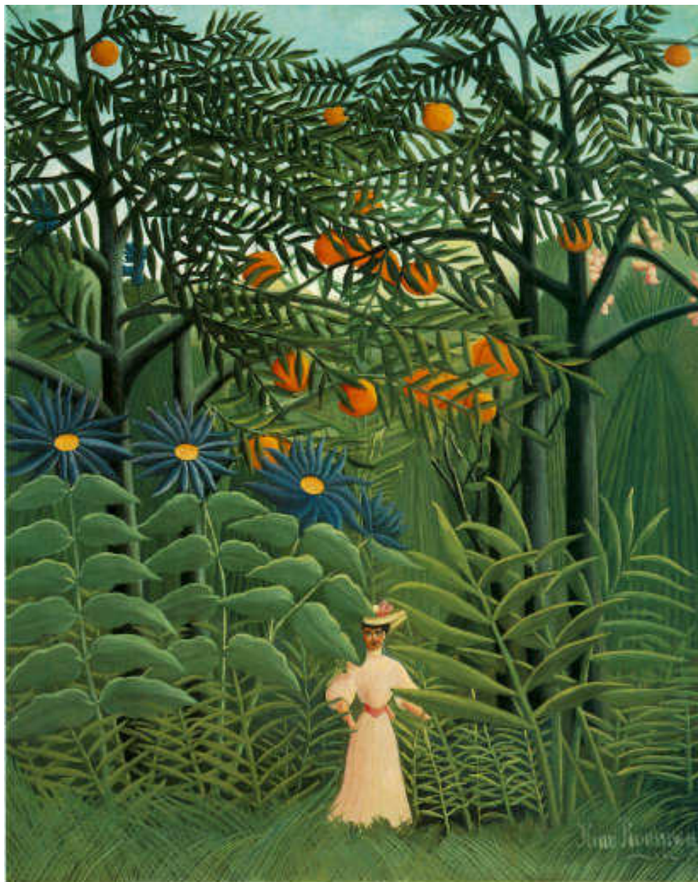
Rousseau henri "אישה הולכת ביער אקזוטי" 1905