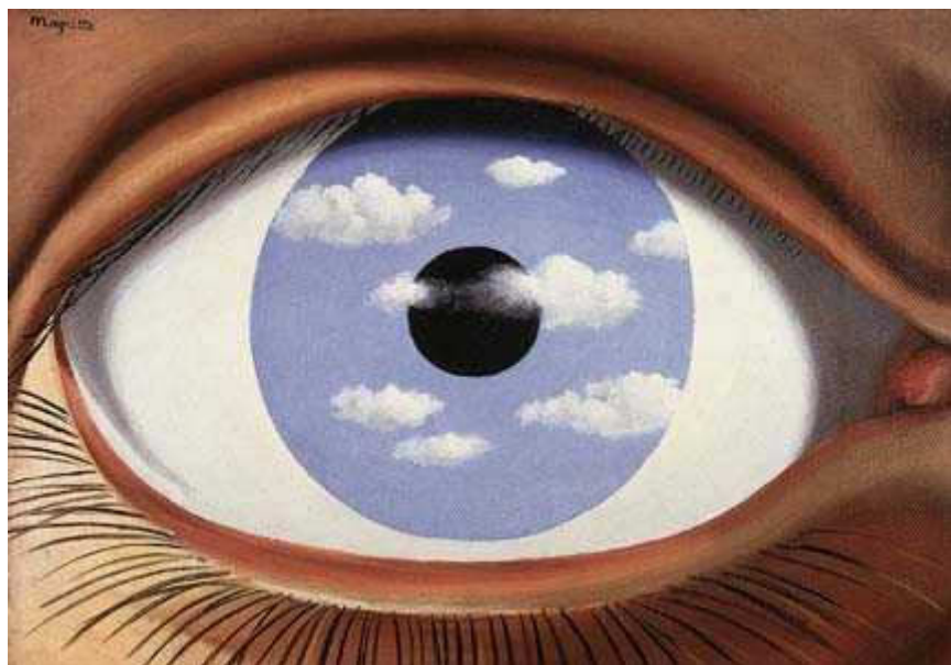
העין הפנימית, שמן על בד.