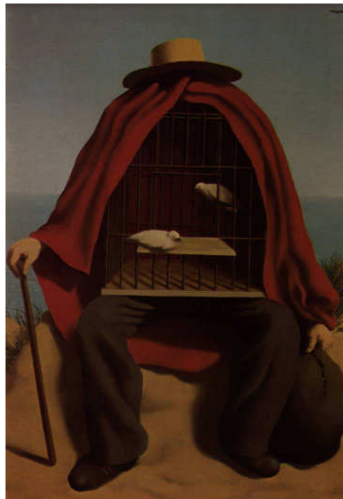
המשחרר, שמן על בד.

תמונות של מגריט טורדות את הצופה ממנוחתו, ביצירתו מתמזגים המציאות והדמיון ונראים מראות מוזרים, המעוררים פחד ואימה, יחד עם מצבים קומיים.