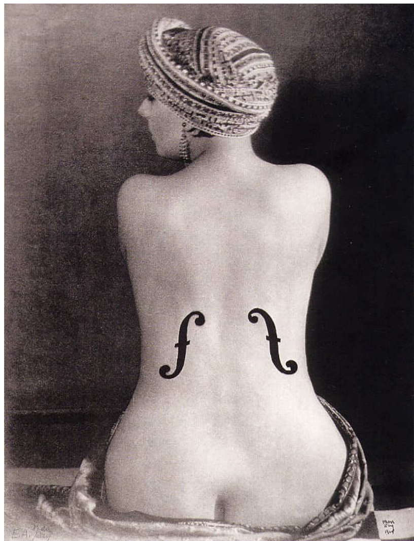
מאן ריי, הכינור של אנגר