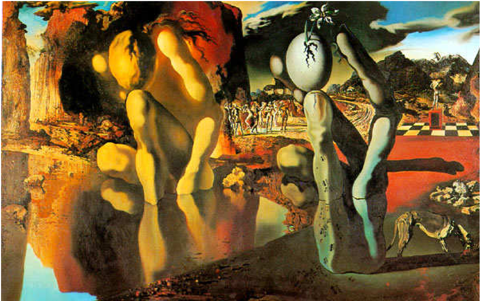
מטמורפוזה של נרקיס