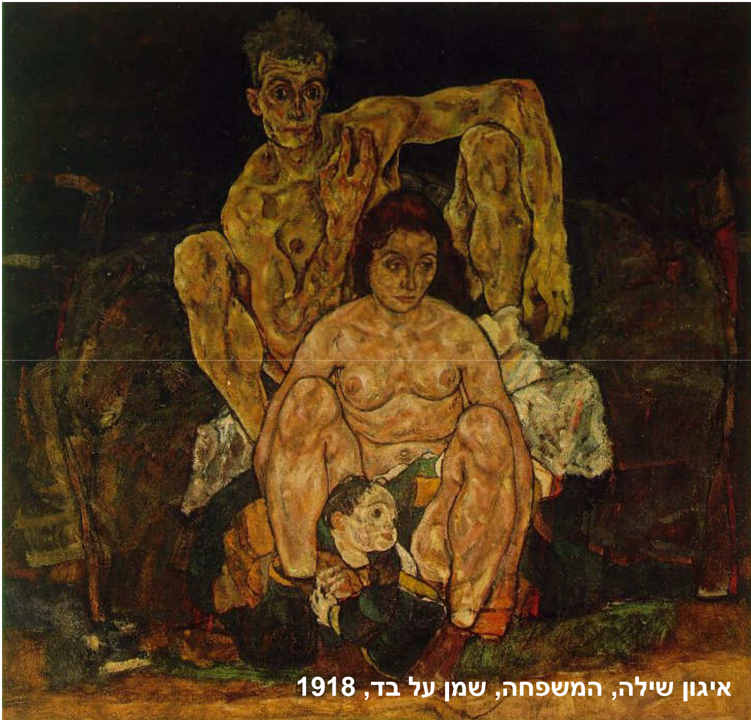
איגון שילה, המשפחה, שמן על בד, 1918